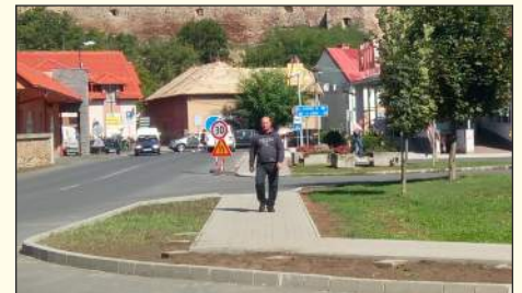
Nový chodník so zámkovou dlažbou pri Bille

Mlynskej ulici. Plocha pod chodníkom v tejto lokalite patrila župe, od ktorej ju mesto odkúpilo za necelých 4-tisíc eur. Ide o komplikovanú, vyše 500-metrovú stavbu s opornými múrmi a zábradlím. Na rozdiel od predchádzajúcich chodníkov ho preto nestavajú pracovníci Verejnoprospešných služieb mesta. Mesto vyhlásilo verejnú súťaž na dodávateľa stavby. Predbežne by mal byť hotový do konca októbra.