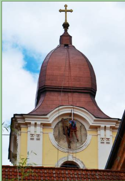
Príprava dreveného podkladu pre nový ciferník